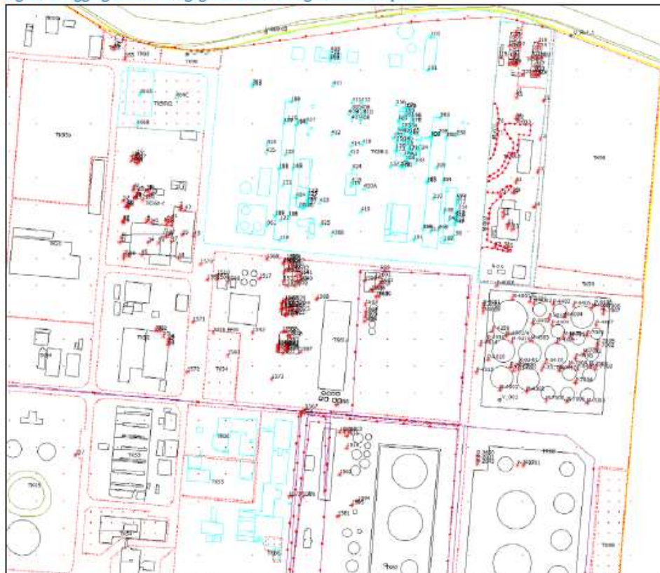
Figuur 1: Ligging en inrichtingsgrens BioMCN in geluidverdeelplan

legende: de items van BioMCN zijn in het blauw weergegeven; de toekomst/kavelbronnen van BioMCN zijn eveneens met een blauwe rand weergegeven (rond DGR ligt alleen nog een smal randje; hierover is geen detailinfo; vermoedelijk hoort dat ook bij DGR; het ontbreken van deze detailinfo heeft geen consequenties voor de rekenresultaten).