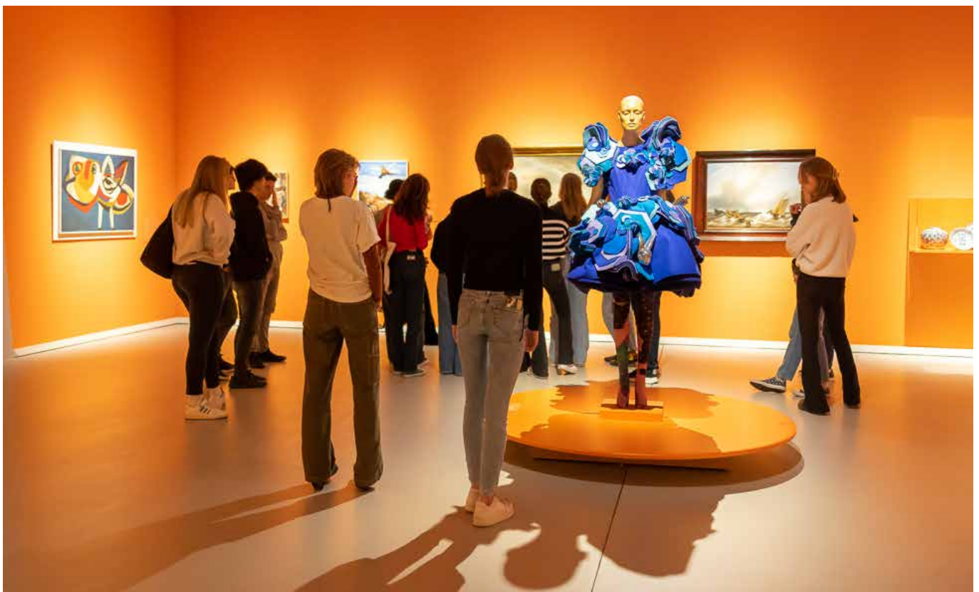
Jeugd dompelt zich onder in kunst in het Groninger museum

Goed cultuuronderwijs vergt een lange adem en commitment van alle betrokken stakeholders. Landelijk is daarom het bestuurlijk kader Cultuur en Onderwijs 1 vastgesteld, waarin wordt aangestuurd op lokale overeenkomsten Cultuur en Onderwijs. Daarop voortbordurend hebben we een eigen regionale vertaling gemaakt, waarbij we onze inspanningen voor een langere periode vastleggen. We doen dit als overheden om onze commitment naar elkaar uit te spreken. Bij de verdere uitwerking en de uitvoering hiervan betrekken we nadrukkelijk het culturele en onderwijsveld. Binnen de Groningse situatie verbreden we onze blik naar het buitenschools cultuuraanbod. Mede door de ontwikkeling van verrijkte schooldagen (zoals Tijd voor Toekomst en School en Omgeving) en met oog op het Akkoord Cultuurbeoefening 2029 is het een logische stap om te denken vanuit samenhang tussen school en de culturele omgeving.