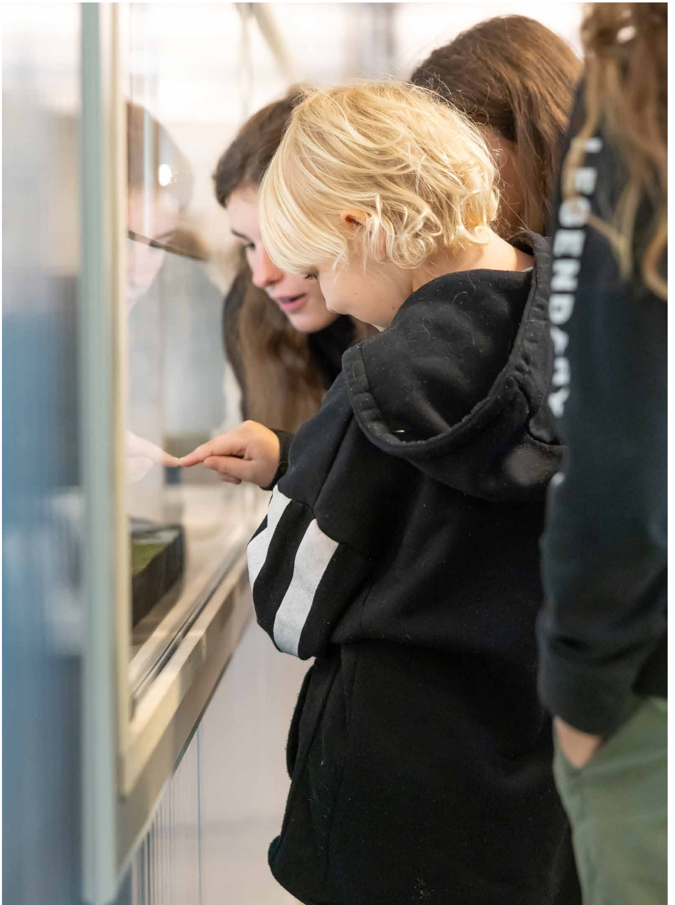
Vol verwondering de schatten in het Noordelijk Archeologisch Depot in Nuis bekijken.