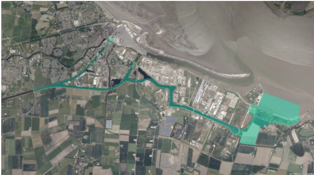
Afbeelding: plangebied kustontwikkeling Eemszijlen

Eemszijlen is een gebiedsgericht project dat zich richt op het oostelijk deel van het centrum van Delfzijl, op de grens met Farmsum in de omgeving van de spuisluis, het watersysteem rondom Delfzijl/Chemiepark en de kuststrook tussen de Pier van Oterdum en de haven van Termunterzijl. Op de onderstaande afbeelding staan de delen van het gebied aangegeven. Voor de verkenning is het onderzoekgebied met opzet ruim gehouden, zodat op voorhand geen kansen worden uitgesloten (brede blik). Het verder inperken van dit gebied is onderdeel van de verkenning.