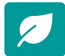
Natuur & klimaat