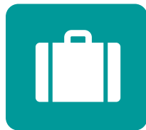
Werken & Leren