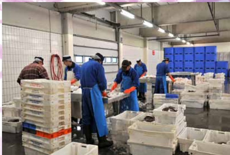
Visafslag in Lauwersoog

De vermarkting van producten uit de Waddenzee kan beter: men is nu nog teveel gericht op kwantiteit in plaats van kwaliteit. Er wordt te weinig gebruik gemaakt van het feit dat producten uit het bijzondere Waddengebied een hoge waarde voor de consument kunnen hebben. Meer aandacht voor de kwaliteit en diversiteit van de producten en voor de mogelijkheden van vermarkting van deze producten, is nodig. Bovendien leggen de producten van zee naar consument een lange weg af via teveel schakels. Dat kan efficiënter. Vissers zouden hogere en stabilere prijzen voor hun vis moeten kunnen krijgen door gebruik te maken van nichemarkten (dus: specifieke en