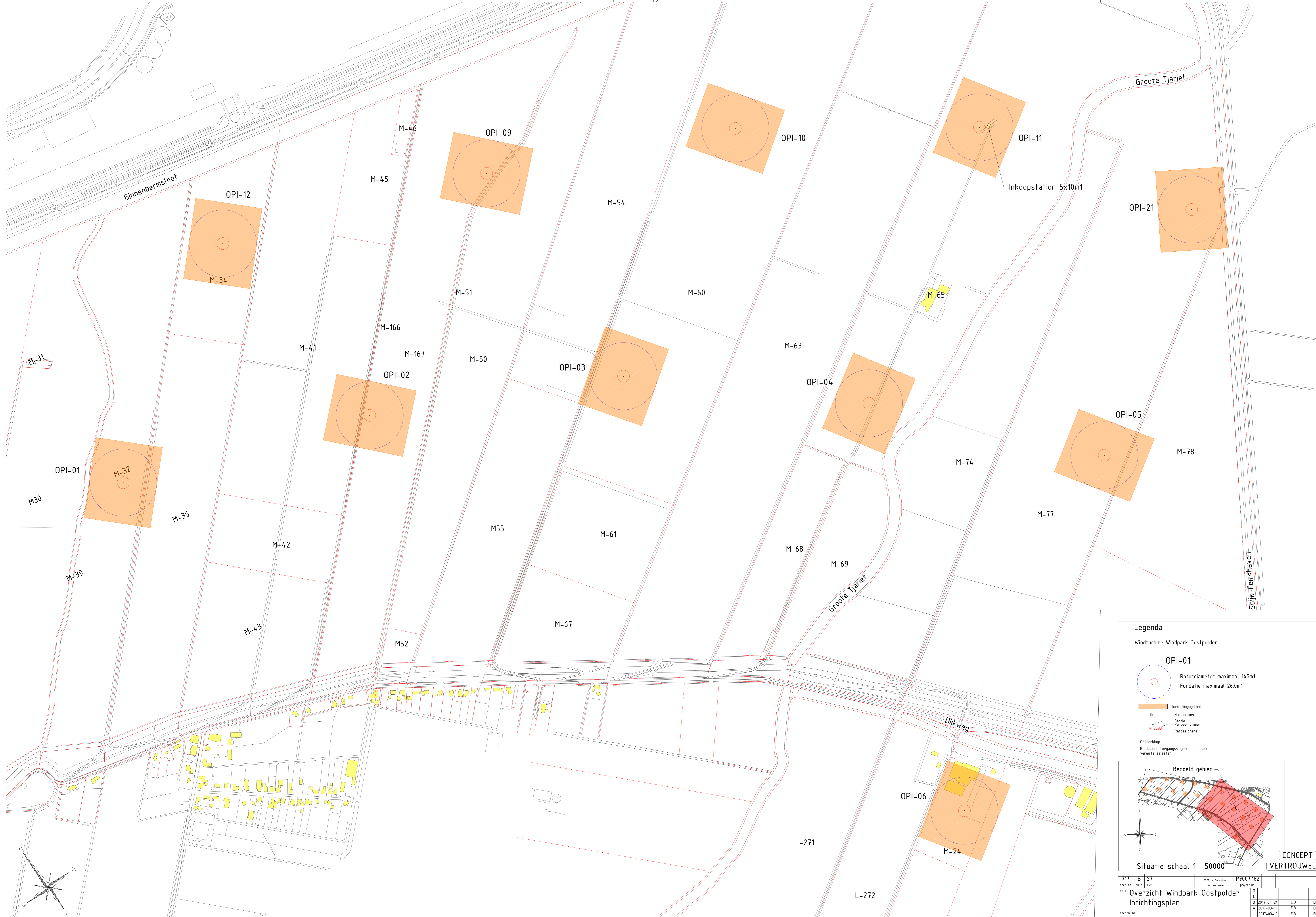
Inrichtingsplan Oostpolder OPI-01 t/m OPI-06 en OPI-09 t/m OPI-12