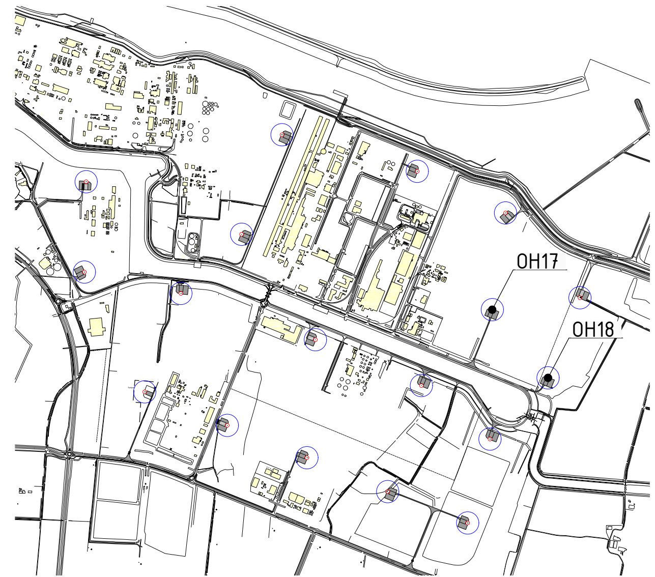
SITUATIE schaal 1:25.000