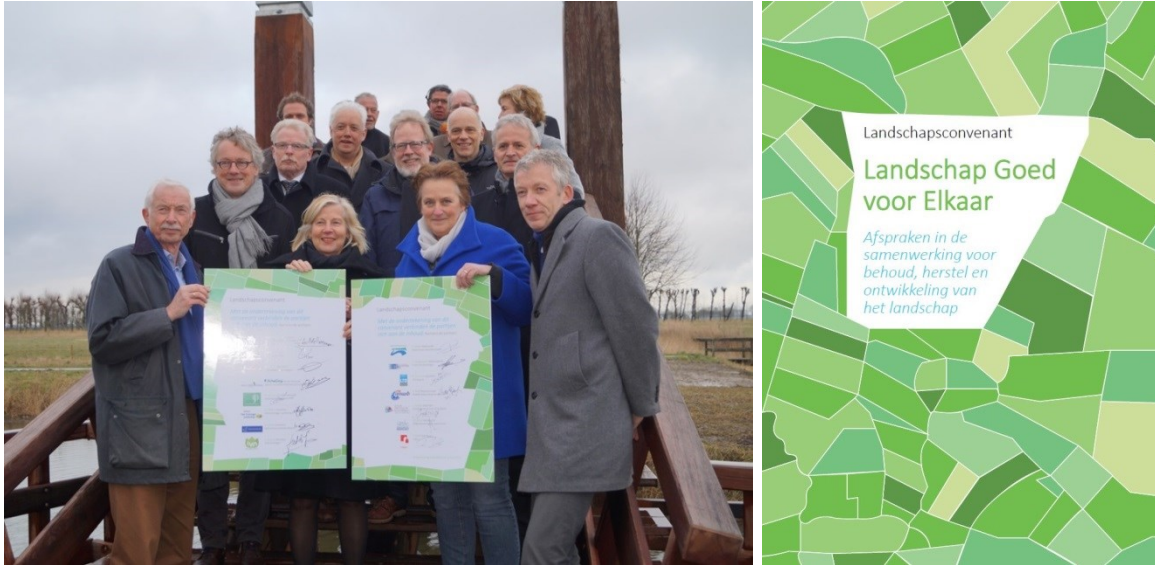
Foto ondertekening Landschapsconvenant Groningen